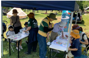
9/17「赤いはちみつの丘フェスタ」 親子向け減災啓発ブース出展