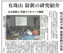
11/25 最新の有珠山研究に触れてみよう! (北海道新聞)