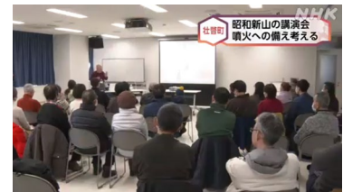
1/13 三松三朗さん講演会 (NHK)